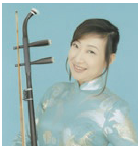
姜建華 ジャン・ジェンホウ(二胡) 指揮者小澤征爾を感涙させた天才奏者